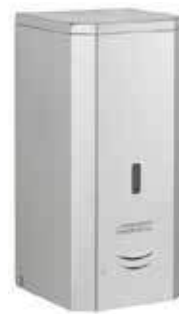
DJ0037ACS Acabado satinado