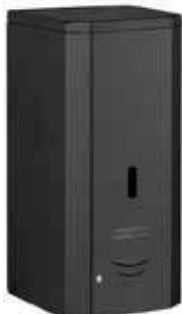
DJ0037AB Acabado negro mate