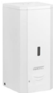
DJ0037A Acabado blanco