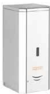
DJ0037AC acabado brillante